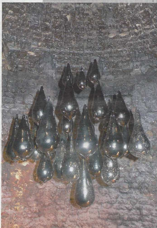
Les gouttes émaillées aux reflets mordorés de la céramiste Gaëlle Guingant-Convert sont suspendues au cœur du four bouteille de l'ancienne poterie de Gradignan